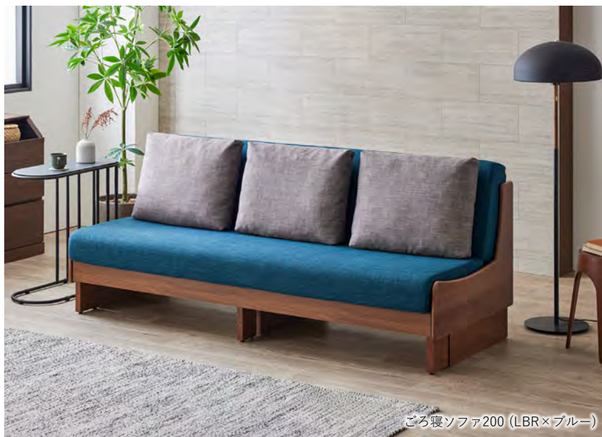
ごろ寝ソファ200 (LBR×ブルー)