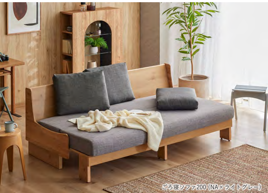
ごろ寝ソファ200 (NA×ライトグレー)