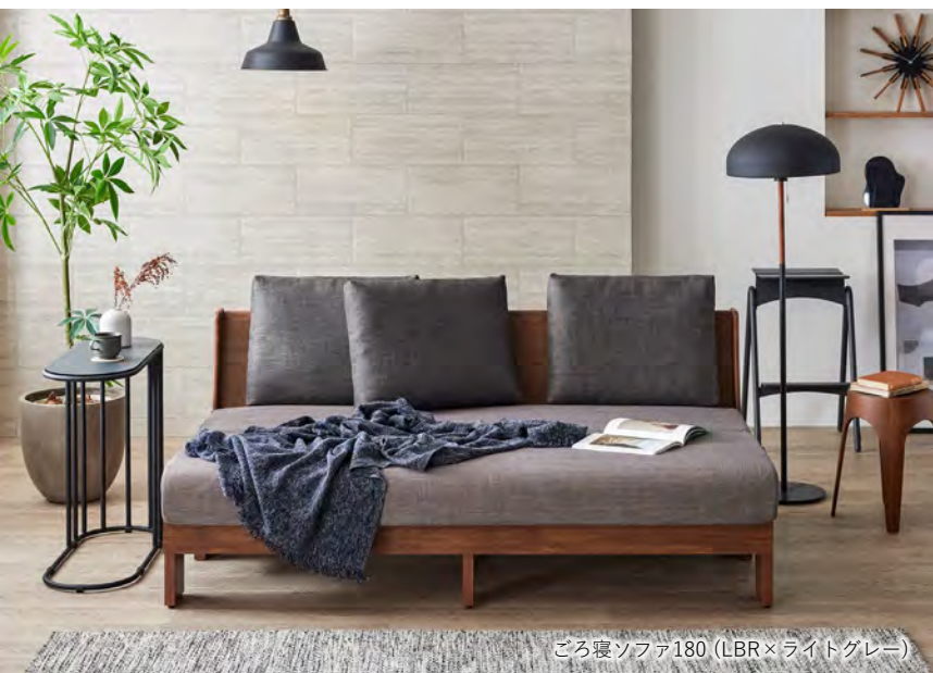
ごろ寝ソファ180 (LBR×ライトグレー)

サイズ：W1805 D1175 H830/SH415（伸長時） W1805 D830 H830/SH415（伸縮時） 置きクッション：3個付き 希望小売価格：¥182,000（税込）