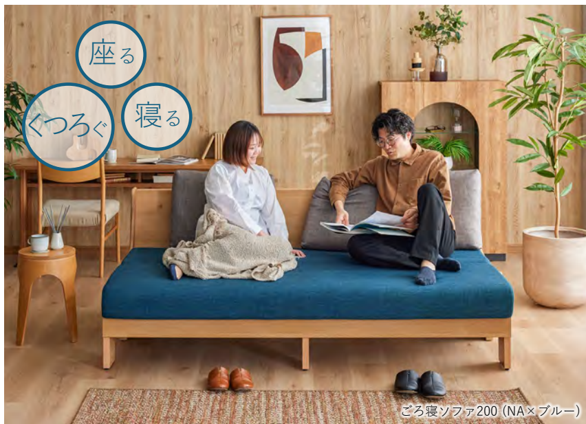
ごろ寝ソファ200 (NA×ブルー)