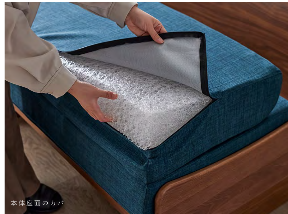
本体座面のカバー