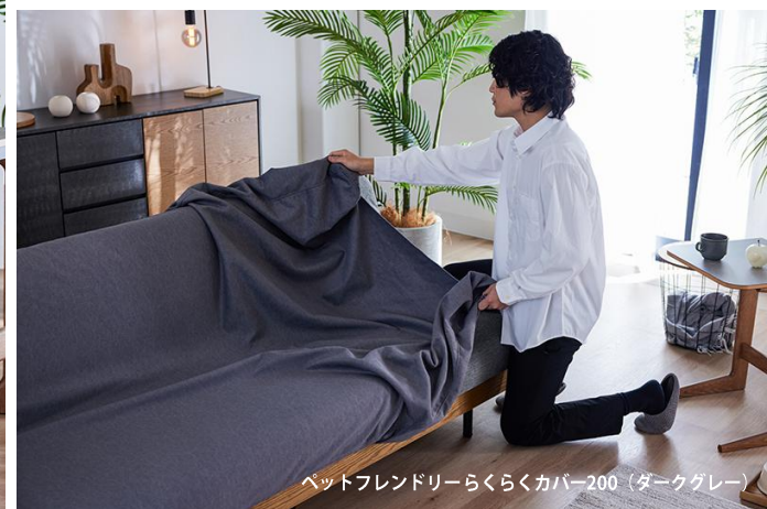
ペットフレンドリーらくらくカバー200 (ダークグレー)