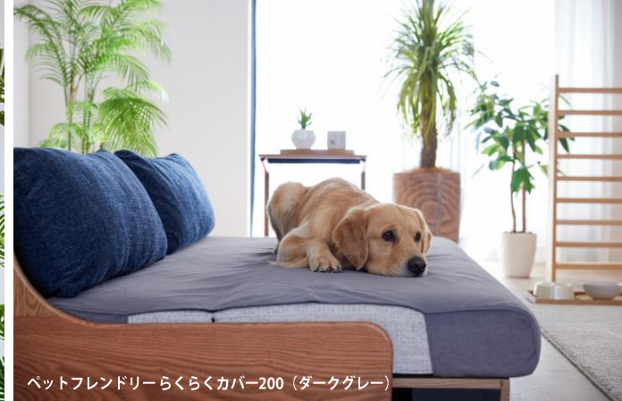
ペットフレンドリーらくらくカバー200 (ダークグレー)