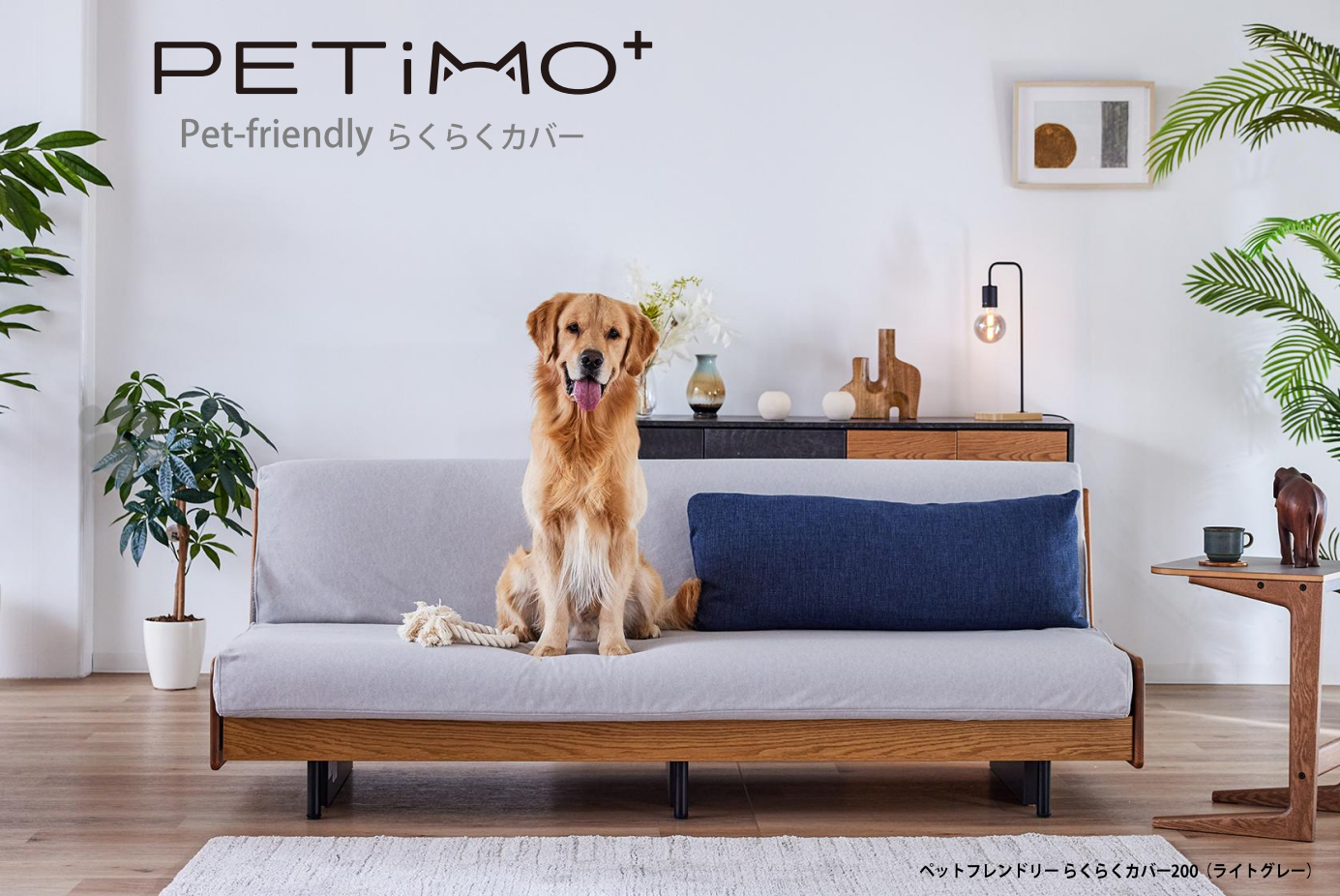
ペットフレンドリーらくらくカバー200 (ライトグレー)